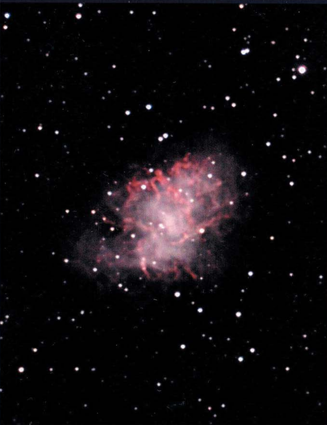
M 1. 210/2569-Dall-Kirkham, Reduzierer auf 1762mm Brennweite, ST2000, 70min (L), 30min (R), 15min (je G, B)