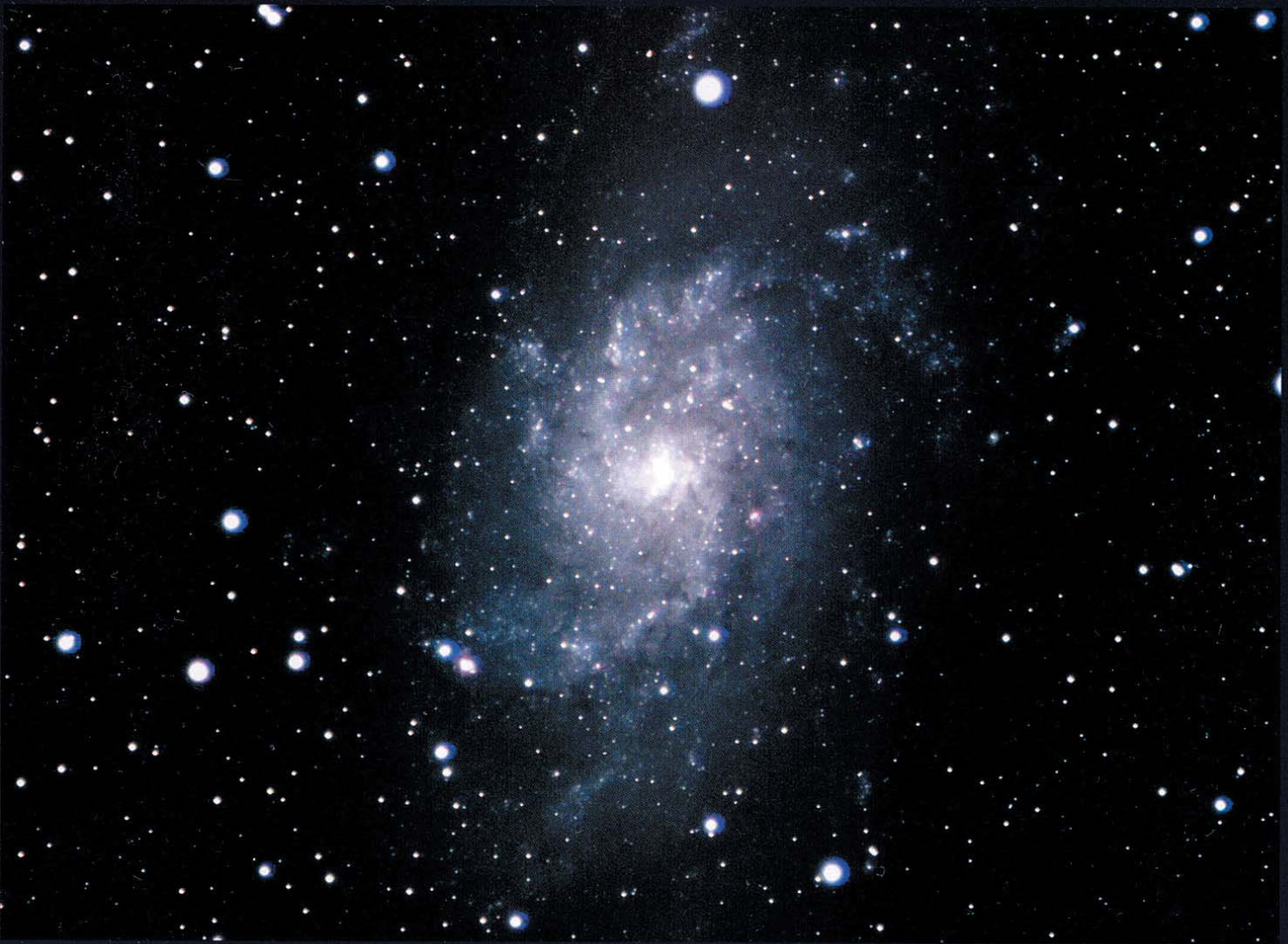
M 33. 100/1000-Refraktor, Reduzierer auf 640mm Brennweite, ST2000, 50min (L), 15min (R), 7min (G), 9min (B)