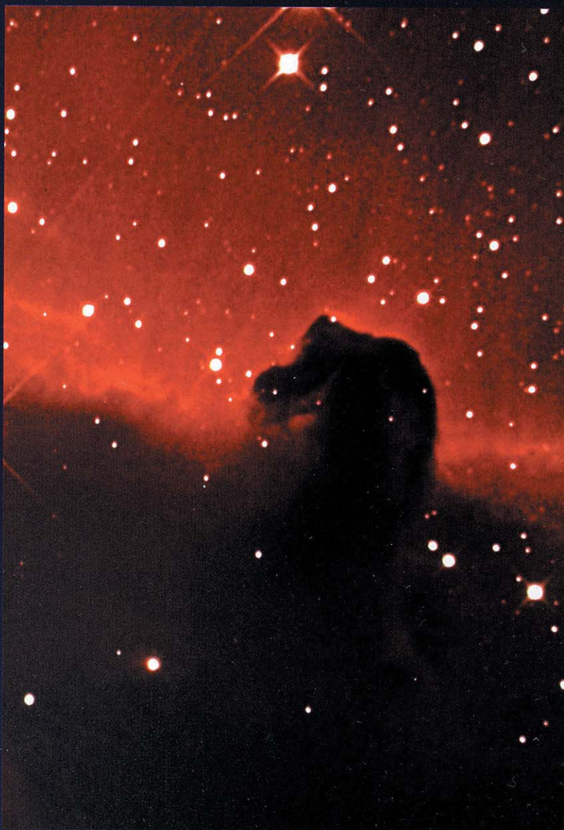
B 33. 210/2569-Dall-Kirkham, Reduzierer auf 1762mm Brennweite, ST2000, 190min (L), 60min (R), 30min (je G, B)