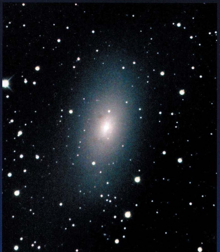
M 110. 210/2569-Dall-Kirkham, Reduzierer auf 1762mm Brennweite, ST2000, 50min (L), 25min (R), 11min (G), 14min (B)