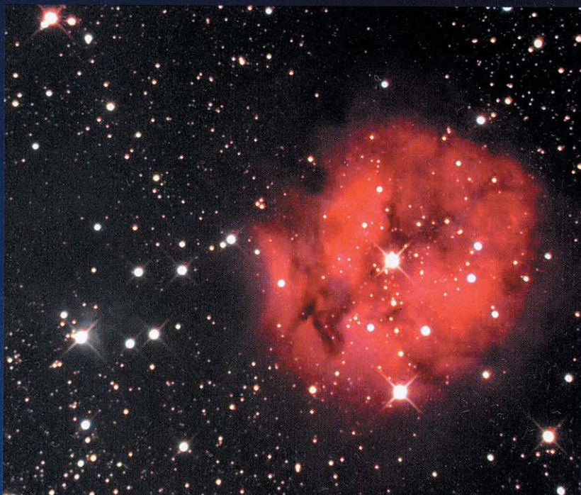
IC 5146. 210/2569-Dall-Kirkham, Reduzierer auf 1762mm Brennweite, ST2000, 90min (L), 60min (R), 30min (je G, B)